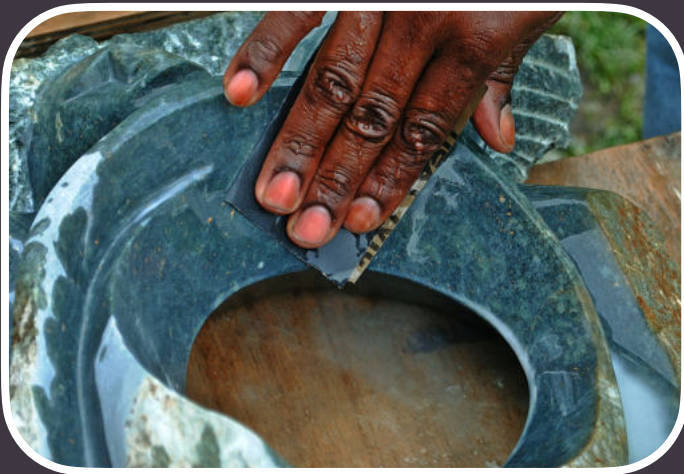
Wasserfestes Schleifpapier zum Polieren