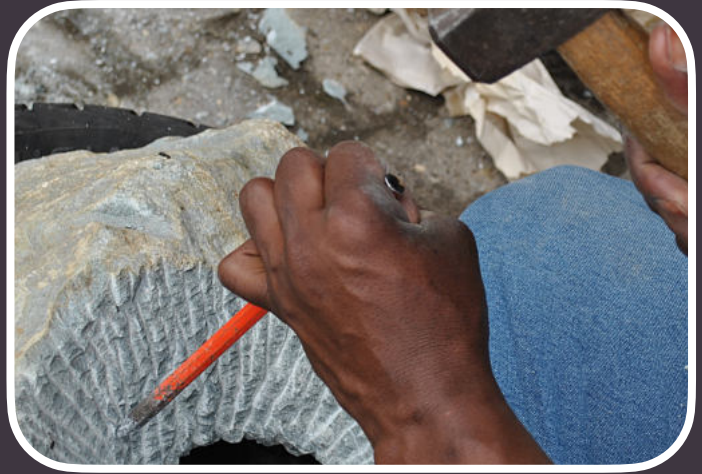
Ciseau à pointe